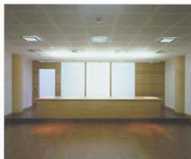
Palais de Justice Poelaert, Bruxelles Éclairage intérieur et extérieur : Barbara Hediger Architecte : CERAU Maître d'ouvrage : Sopima